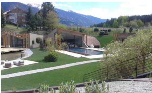
Impressionen von der Umgebung