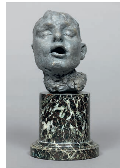
Fotos VALENTINA SOMMARIVA/CASA FLORA, MARCO ILLUMINATI/MUSÉE CAMILLE CLAUDEL (2), WALLEDOFFHOTEL.COM (2) Kunst © MUSÉE CAMILLE CLAUDEL

MUSÉE CAMILLE CLAUDEL 10, rue Gustave Flaubert, Nogent-sur-Seine, museecamilleclaudel.fr