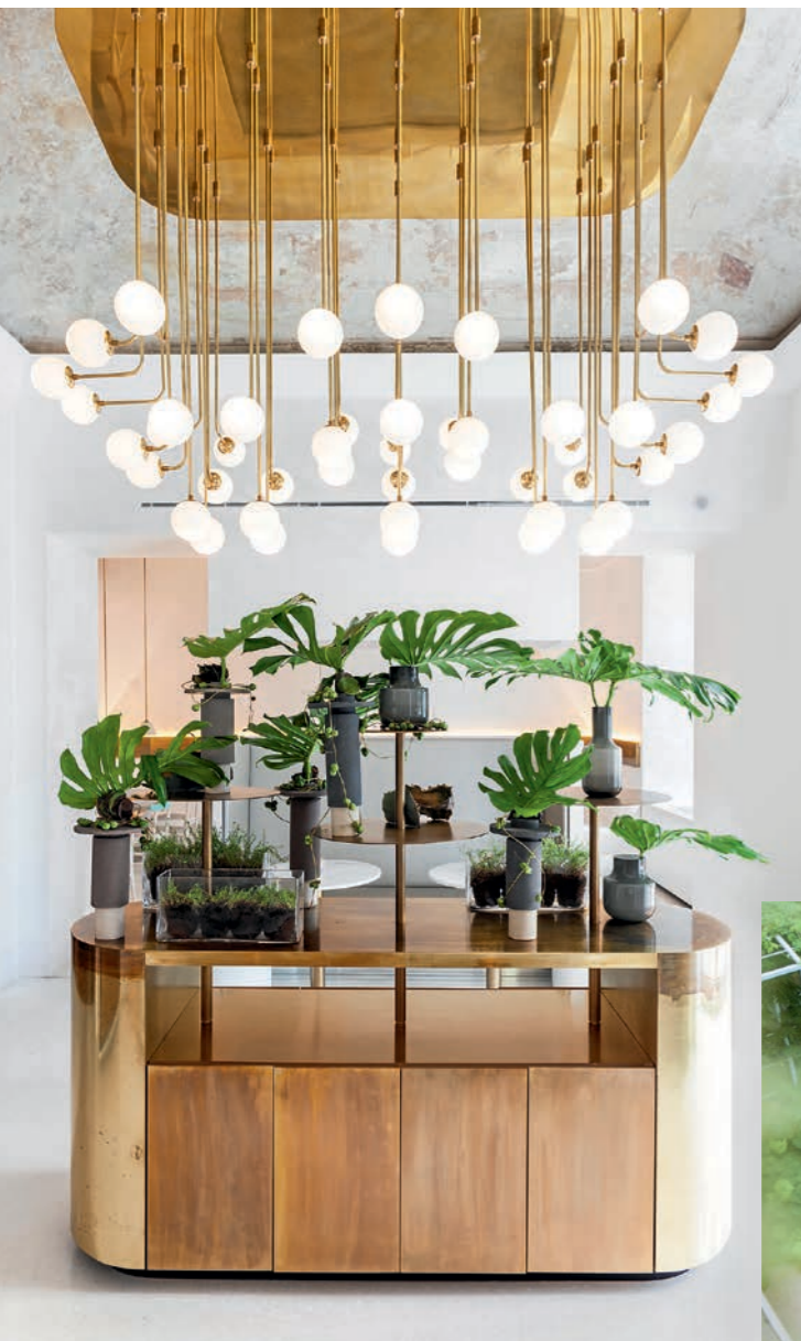
SENATO HOTEL MILANO Via Senato 22, Mailand, ab 220 € pro Übernachtung im DZ, senatohotelmilano.it